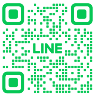
【制作補助スタッフ】