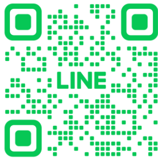
【ケータリングスタッフ】